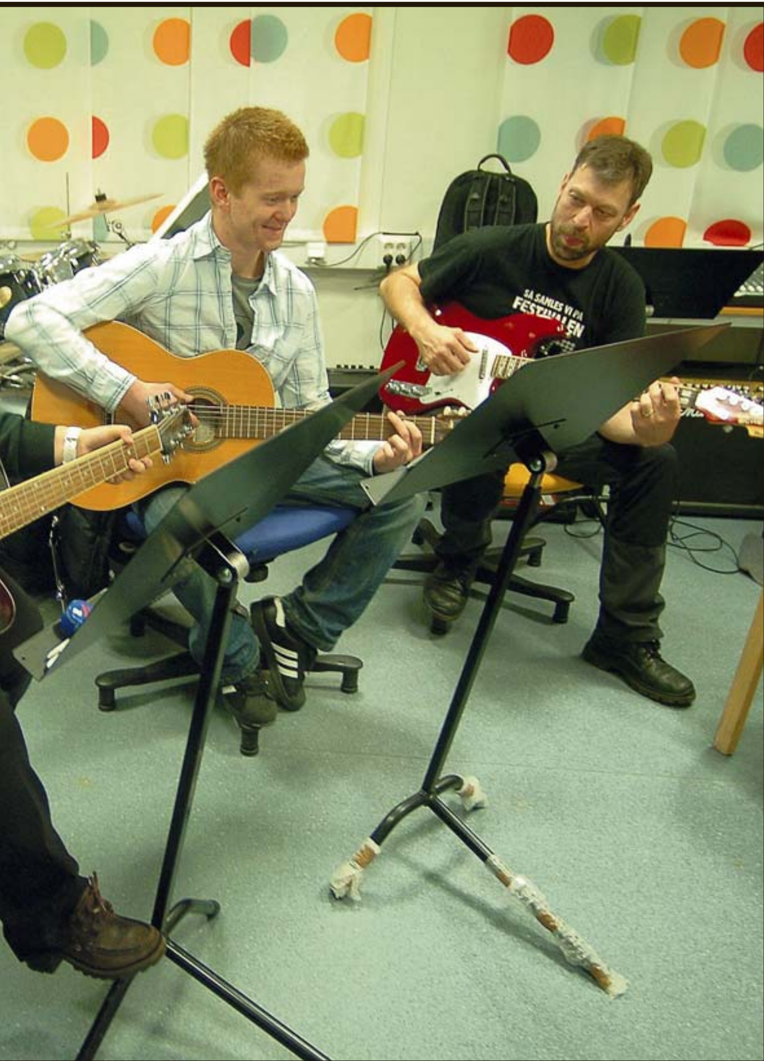
lyst til å begynne på gitarkurs i flere år, og benyttet anledningen da de så annonsen for kurset tidligere i høst. De er begge fornøyd med den opplæringen de